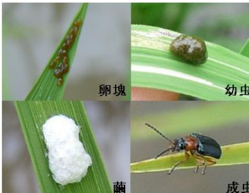
イネドロオイムシ