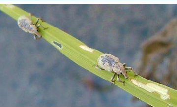
イネミズソウムシ