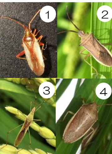
斑点米カメムシ類