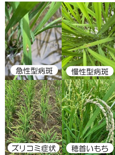
葉いもち・穂いもち