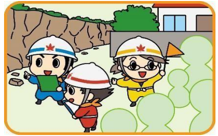
▲地域の危険箇所点検