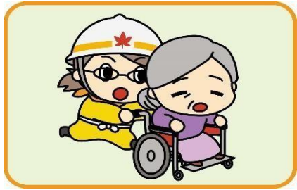
▲避難や情報伝達の訓練

地域で防災意識を高めるための講演会の講師代や、事務用品、訓練に必要な資機材など様々な経費が対象です。