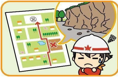
▲防災マップづくり