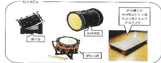
ご協力、ありがとうございました。