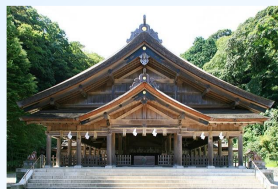
ゑびす様の総本宮 美保神社