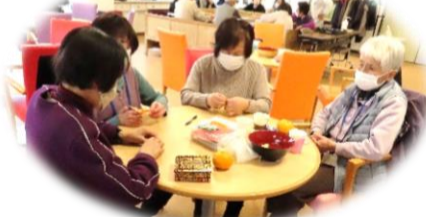
折り紙でコマ作り♪

3月12日は食事会。メニューは、ちらし寿司、煮物、豆腐のすまし汁、デザートでした。