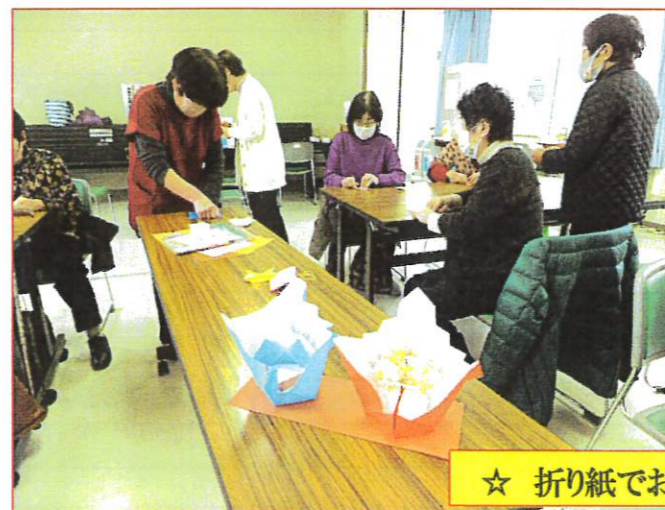
☆ 折り紙でお雛様づくり