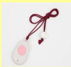
ペンダント型発信機

ふれあい安心電話を利用し、健康相談や緊急通報を行うことで安心・安全な生活を送りましょう。