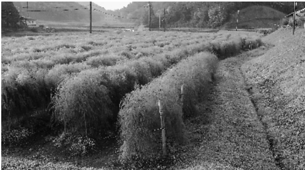
1億円園芸産地づくりの一つ、アスパラ栽培

Q 自治振興費のコミュニティ施設整備補助増額補正は A 80万円を限度とし、2施設160万円の助成である。