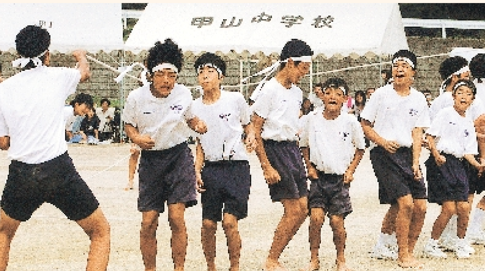
甲山中学校運動会 “みんなみてるぞ、がんばろうぜ”