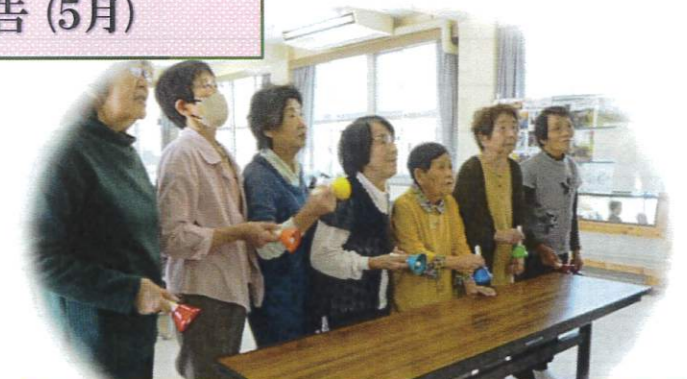
ハンドベル とても上手になりました