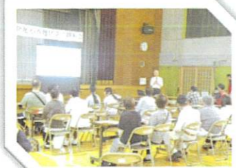
防災気象情報の講話、地域防災タイムライン作成