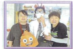
避難すごろくゲーム

今年は放課後子ども教室の子ども達が、避難すごろくを作り上げていってくれました!! おかげ様で楽しい防災研修会ができました!