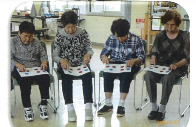
歌いながら指でリズムとりゲーム