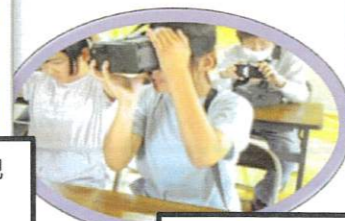
VRゴーグルで災害体験