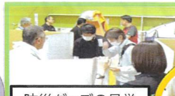
防災グッズの見学