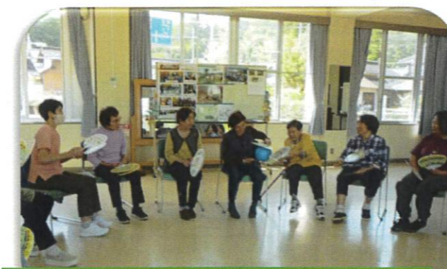
ジャンケン勝負でボール回し