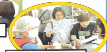
非常食の調理・試食

今年は放課後子ども教室の子ども達が、避難すごろくを作り上げていってくれました!! おかげ様で楽しい防災研修会ができました!