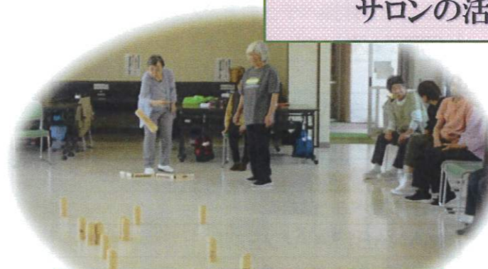
モルックでパワー全開