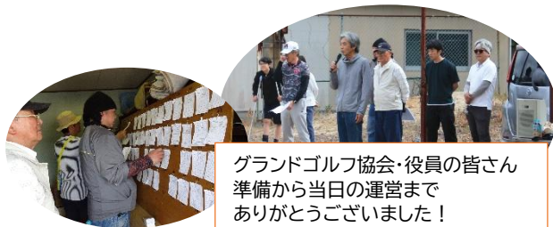
グランドゴルフ協会・役員の皆さん準備から当日の運営までありがとうございました！