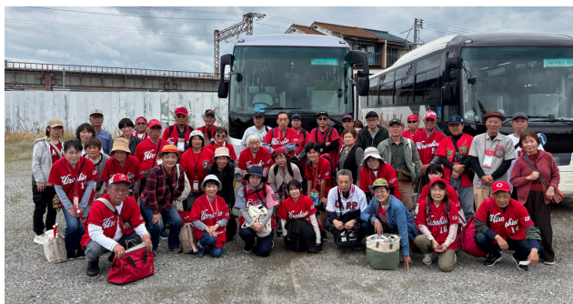
山福田・青水のみなさんと一緒に行きました♪