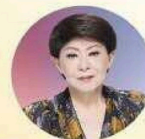
みかわ けんいち 美川 憲一