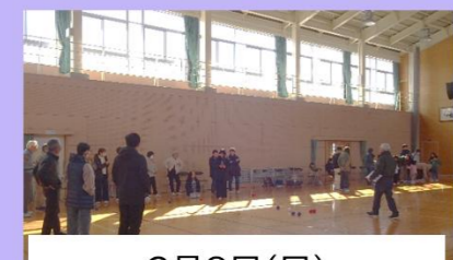
2月8日(日) さわやかスポーツ教室 ポッチャ