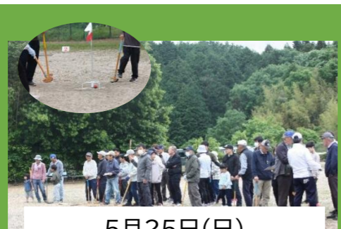
5月25日(日) 宇津戸グランドゴルフ大会