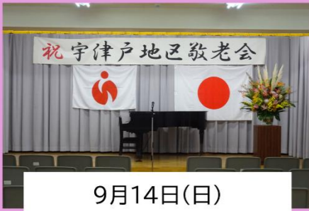
9月14日(日) 宇津戸地区敬老会