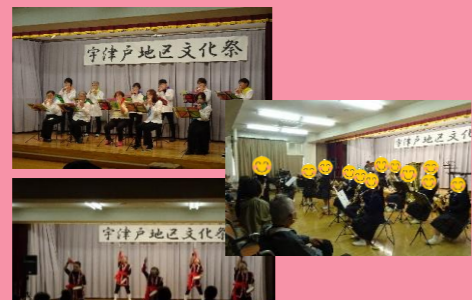
10月26日(日) 宇津戸文化祭