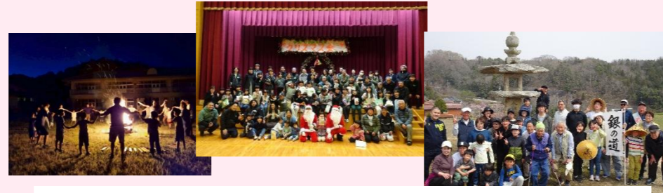
宇津戸子ども会育成会 サマーキャンプ、「うづと万博」・子ども祭り、 クリスマス会、ウォーキング