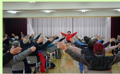
3月8日(日) 宇津戸地区健康まつり