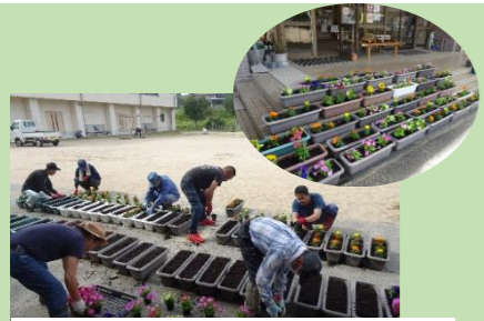
5月17日(日) 花いっぱい運動