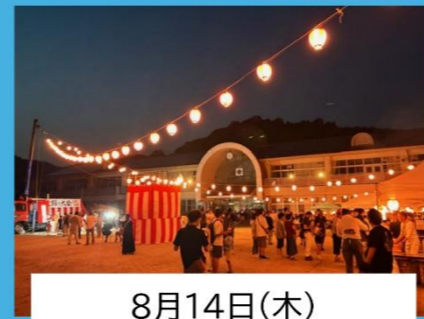
8月14日(木) 宇津戸地区盆踊り大会