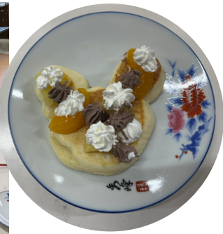
3/25つくしっ子でホットケーキを作ったよ♪