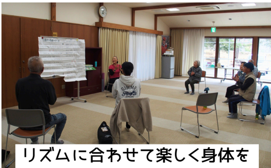
リズムに合わせて楽しく身体を動かしました