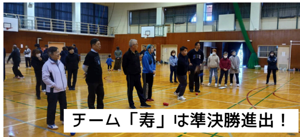
チーム「寿」は準決勝進出！

津久志から4チームが参加し、1チームは準決勝まで進みました！他地域の方々とも交流でき楽しい大会となりました♪