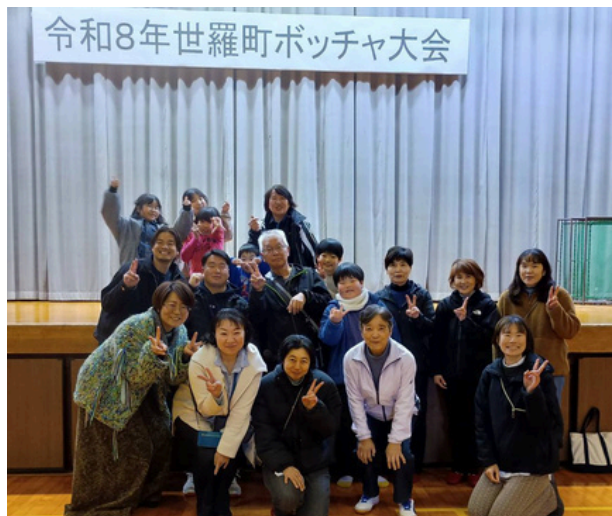
令和8年世羅町ポッチャ大会

津久志から4チームが参加し、1チームは準決勝まで進みました！他地域の方々とも交流でき楽しい大会となりました♪