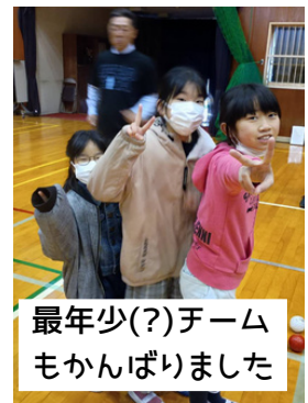
最年少(?)チームもかंबりました