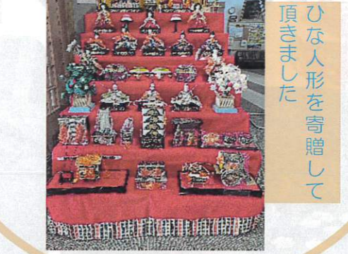
ひな人形を寄贈して 頂きました