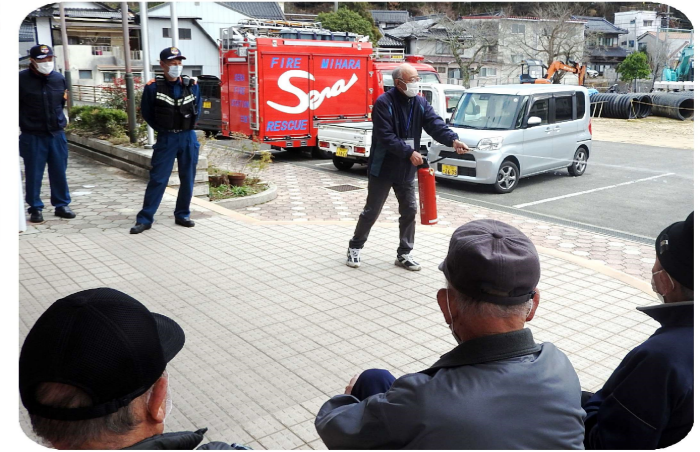
(スタッフによる消火器訓練の様子)

その後、1階調理室から出火したという想定で、避難訓練とスタッフによる消火器訓練を行いました。