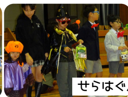
せらはるハロウィン