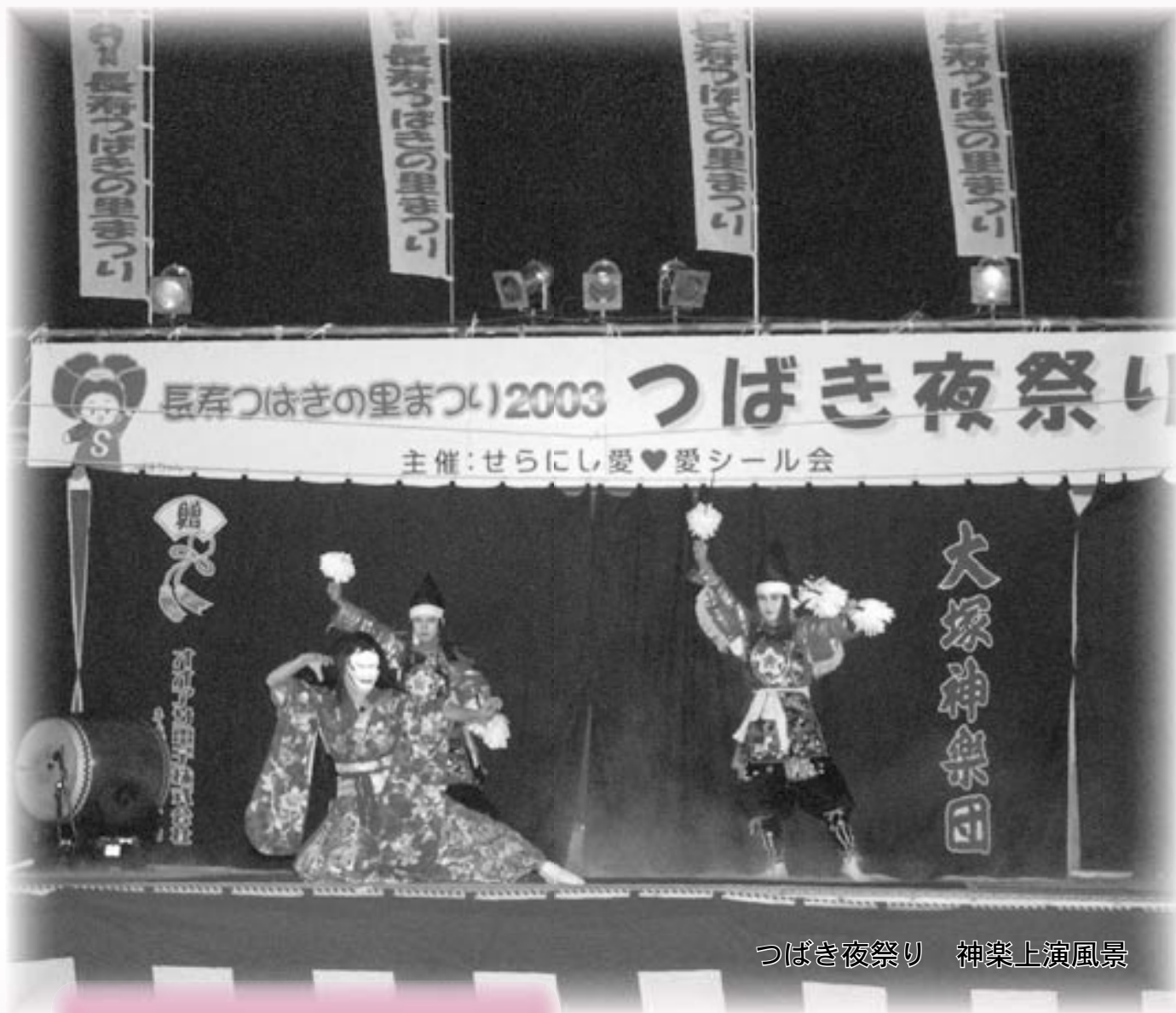
つばき夜祭り 神楽上演風景

「条例、規則の取扱い」 「使用料、手数料等の取扱い」 「特別職の身分の取扱い」 「学校教育関係の取扱い」 以上4項目について確認。