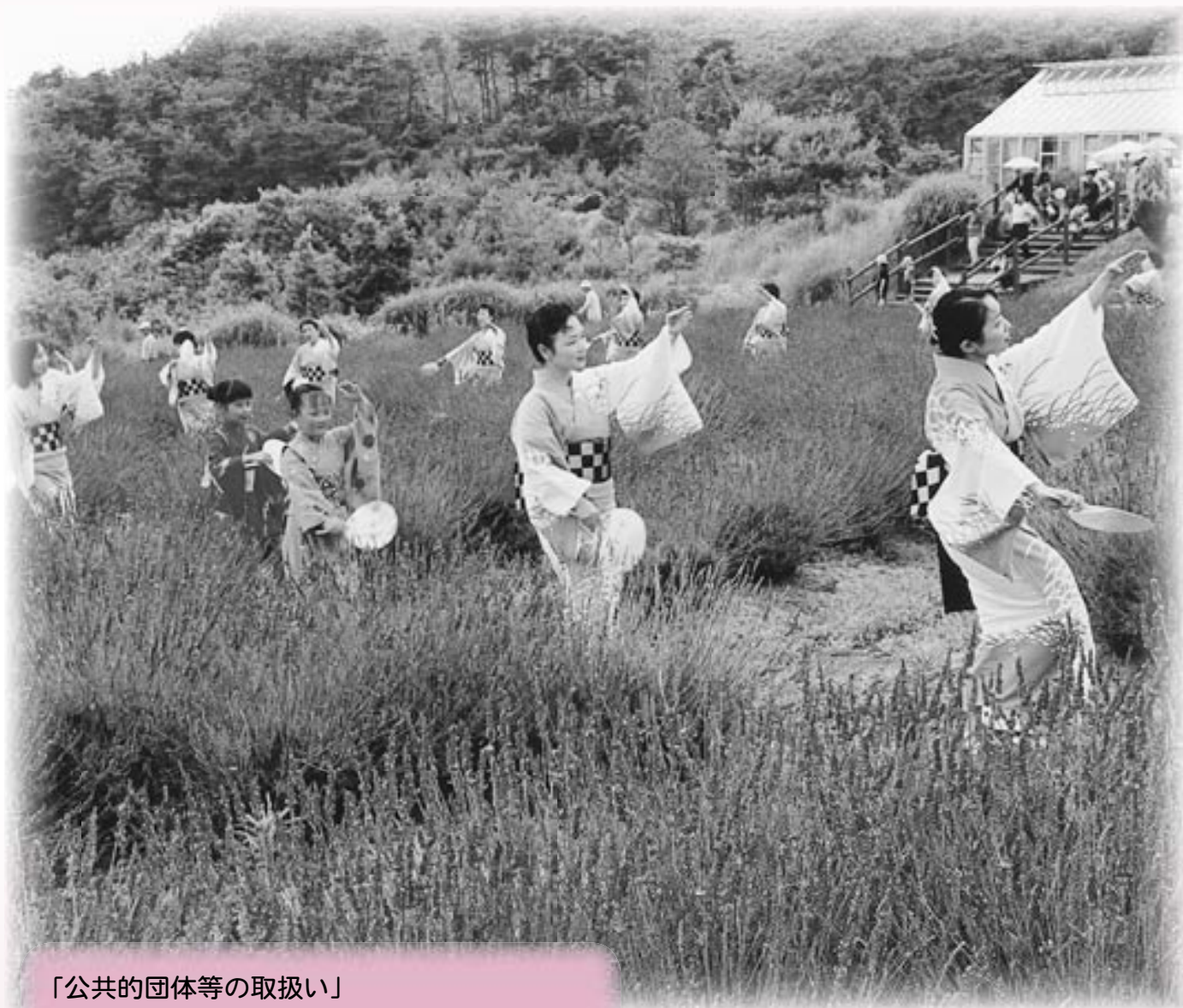
甲山町 香山ラベンダーの丘

「公共的団体等の取扱い」 「保健衛生の取扱い（その1）」 「人権対策の取扱い」 「商工観光関係事業の取扱い」 「建設関係事業の取扱い」 以上5項目を確認。 「新町の事務所の位置」については継続協議。