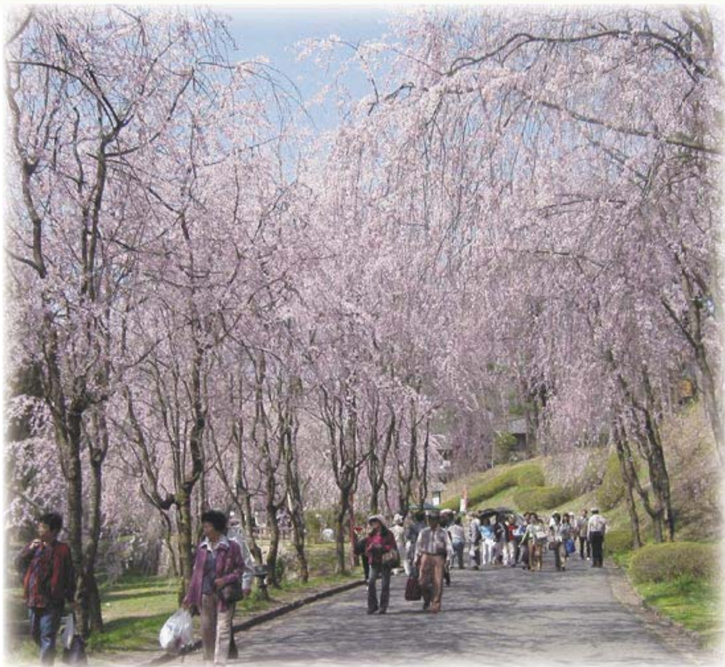
甲山町 甲山ふれあいの里