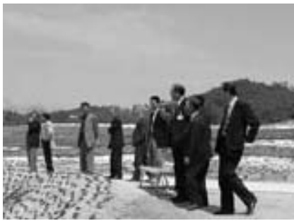
タウンウォッチング