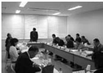
第4回事務所の位置選定小委員会