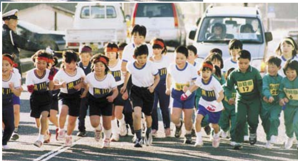
第45回世羅西町駅伝競走大会