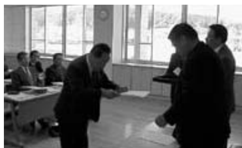
協議会委員の任命