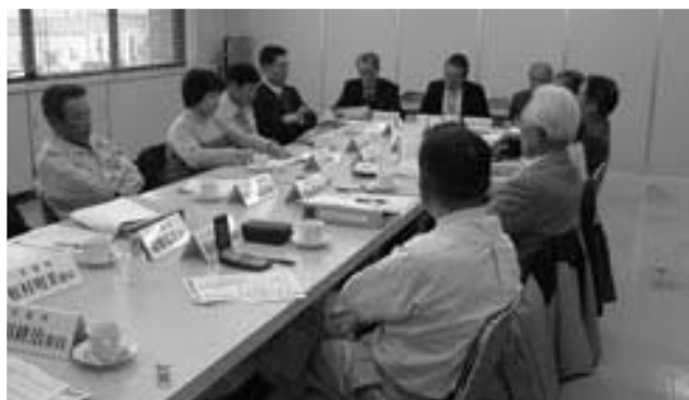
第3回名称候補選定小委員会