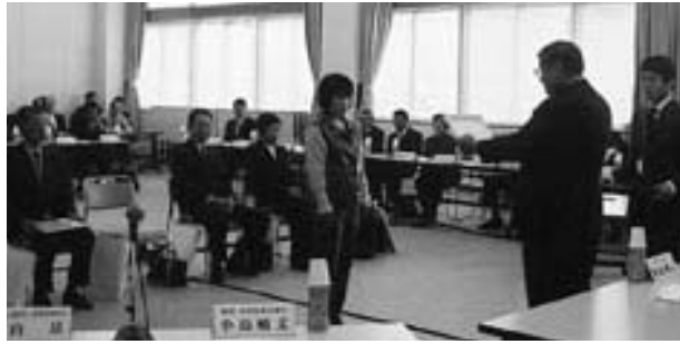
名付け親賞授賞式

11月5日 新町名称名付け親賞授賞式の開催 第15回世羅郡三町合併協議会 協議事項 協議第58号 議会議員の定数及び任期の取扱いについて(継続協議) 第16回世羅郡三町合併協議会 協議事項 協議第58号の2 議会議員の定数及び任期の取扱いについて