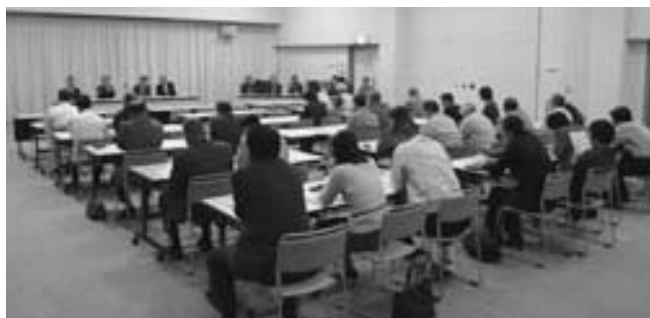
住民説明会（新町建設計画）