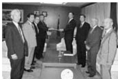
協議会設置の届出