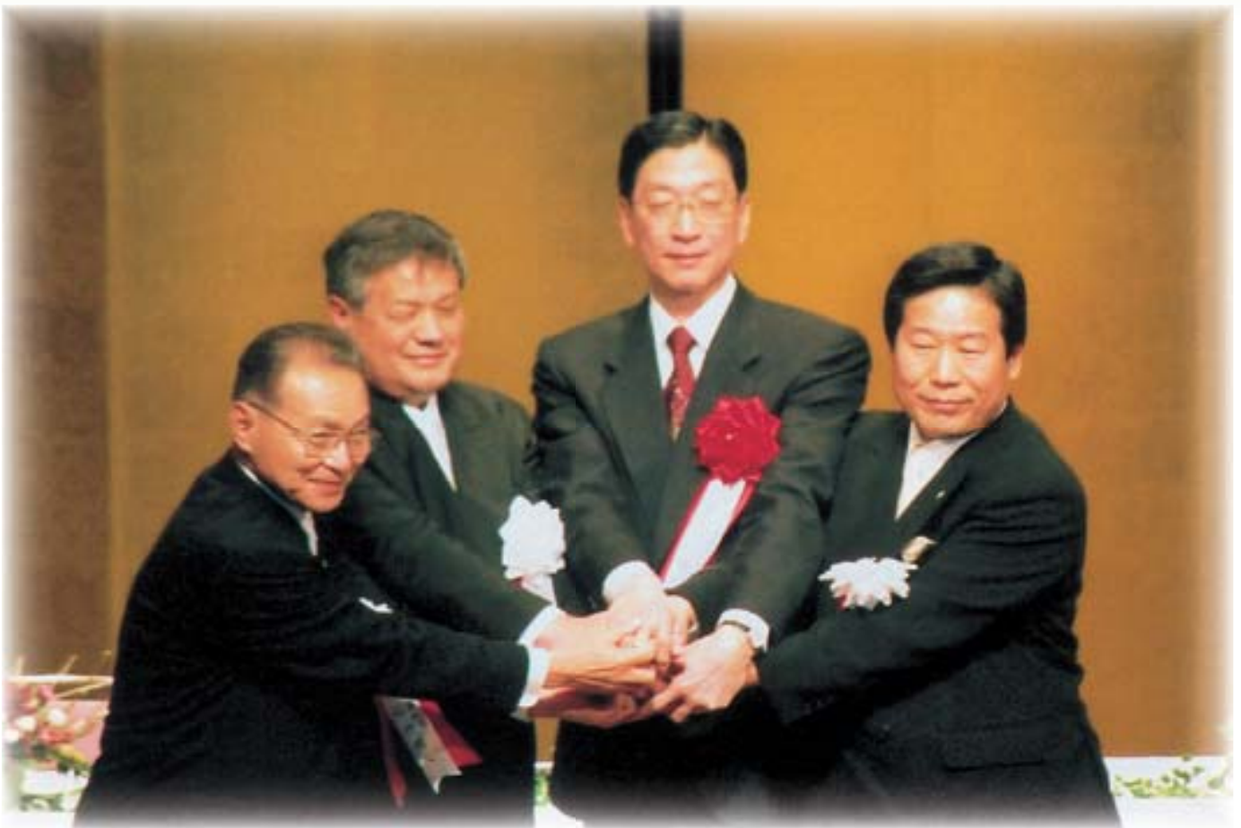
合併協定書調印後、固い握手を交わす3町長と知事 (左から松山世羅町長、上本世羅西町長、藤田広島県知事、山口甲山町長)