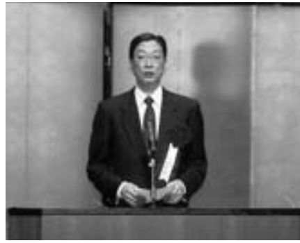
藤田雄山 広島県知事