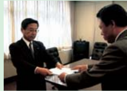
申請書を桂木市町村合併推進室長へ提出

今後、広島県議会での議決、総務大臣の告示を経て、平成16年10月1日に新「世羅町」が誕生することになります。