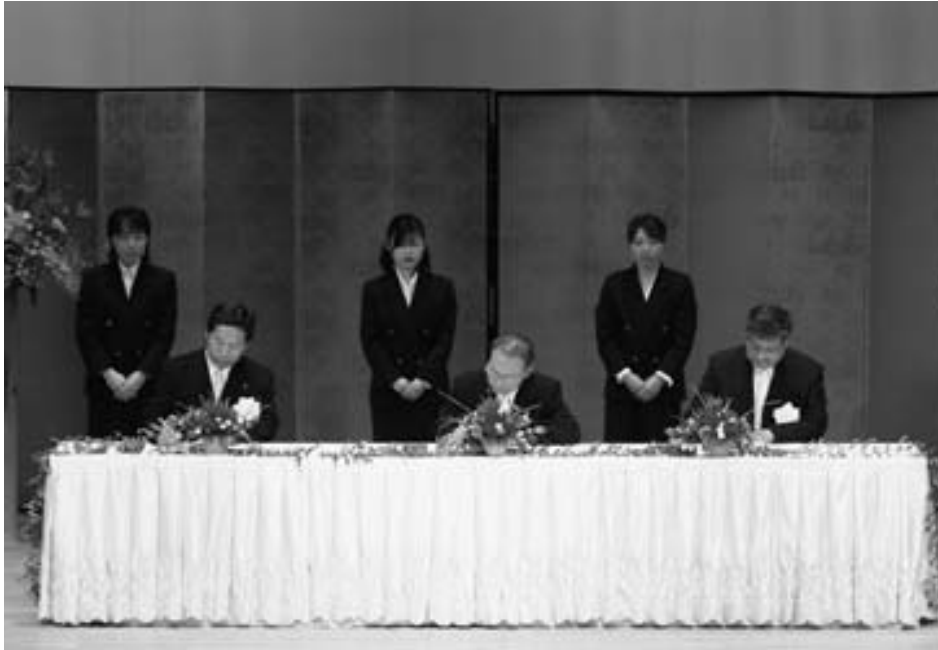
合併協定書に調印する3町長

その後、山口甲山町長、松山世羅町長があいさつを行い、来賓を代表して藤田雄山広島県知事、小島敏文広島県議会議員よりご祝辞をいただきました。