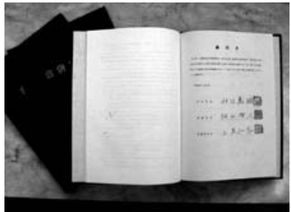
調印された合併協定書

これまでの間、この合併を側面から支えていただいた方々、また一方でこの合併に疑問を抱かれた方もございました。こうした数ある意見や議論の中で世羅3町合併が整い今日の日を迎えております。 こうした方々の、切実・誠実な思いは新町の町づくりの過程において、貴重な糧として大切にされるべきであります。 合併と言う大きな門前まで、進めさせて頂きましたが、合併期日の10月までの残すところわずかの期間の中で多くの実務を抱えております。 これからも、合併協定40項目を基本に3町連携を密にして一つひとつの事柄を大切に調整・整理させて頂き、新町に臨む決意でございます。 本日は、晴れの世羅郡3町の合併調印式にあたり、多くの皆様方のご臨席を賜り無事