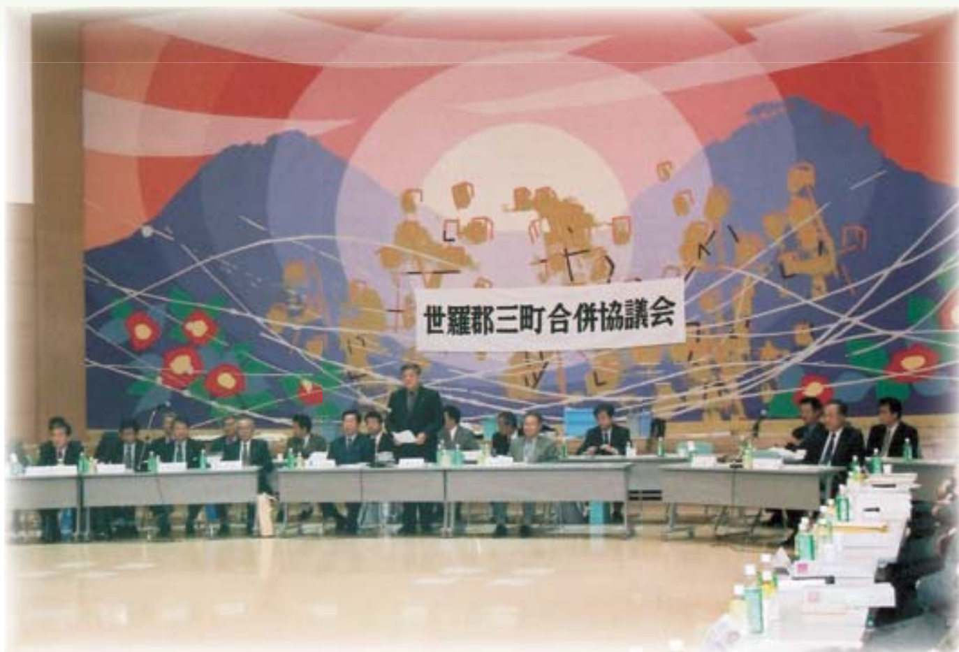
第17回世羅郡三町合併協議会