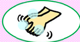
てのひら・てのこうを洗う